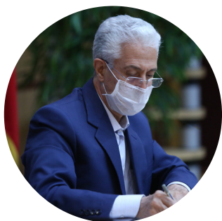
دکتر منصور غلامی وزیر علوم، تحقیقات و فناوری