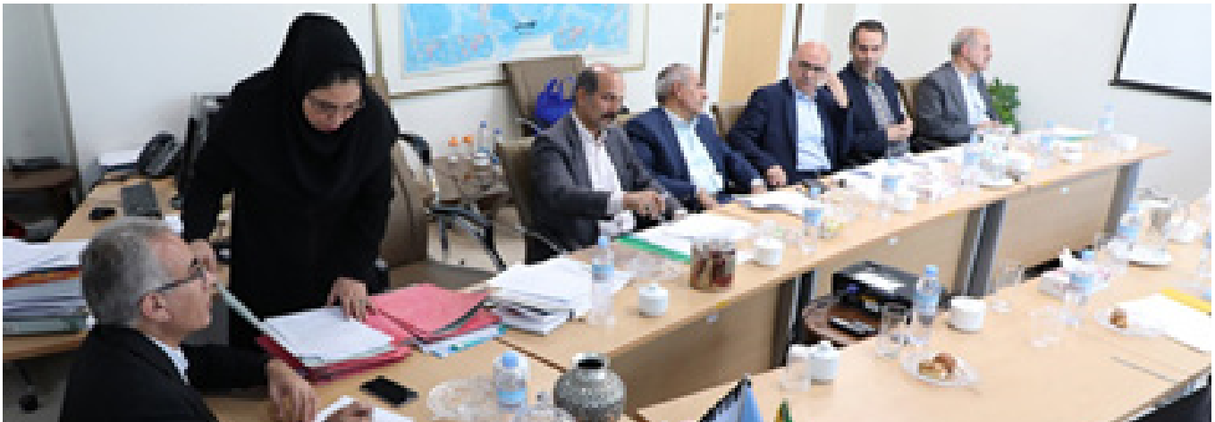
برگزاری جلسات با استادان زبان فارسی در معاونت گسترش فارسی و ایران‌شناسی مرکز همکاری‌های علمی بین‌المللی وزارت علوم - ۱۳۹۹

سرفصل‌های درسی زبان و ادبیات فارسی و ایران‌شناسی در کرسی‌های خارج از کشور، عمدتاً قدیمی و فاقد هماهنگی و تناسب با اوضاع تاریخی و فرهنگی جدید ایران‌اند؛ بنابراین، از حدود سه سال پیش، چند کارگروه تخصصی در معاونت گسترش زبان فارسی تشکیل شده است تا سرفصل‌های درسی زبان و ادبیات فارسی و ایران‌شناسی کرسی‌های خارجی را بازنگری و بازنگاری کنند و سپس منابع درسی مناسب و روزآمد در قالب کتاب و منابع دیجیتال برای آنان تألیف کنند. خوشبختانه این کار مهم، مراحل پایانی